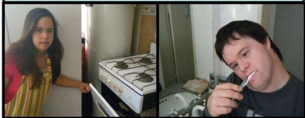
"Centro Claudina Thevenet" Buenos Aires, Argentina